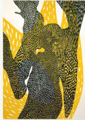
ARIS * SENZA TITOLO

STAMPA RISOGRAPH A DUE COLORI SU MUNKEN WHITE 1.8 115 GR. 29,7 CM X 42 CM (A3). EDIZIONE LIMITATA DI 50 COPIE FIRMATE E NUMERATE DALL'ARTISTA.