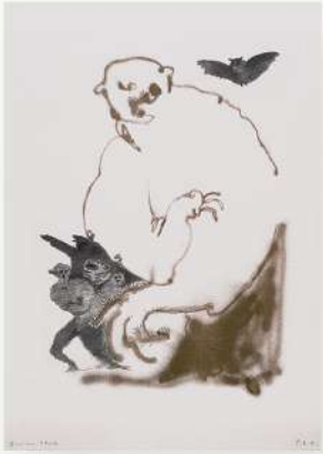
GUERRILLA SPAM "NON SE NE SONO MAI ANDATI"

STAMPA RISOGRAPH A DUE COLORI SU MUNKEN WHITE 1.8 115 GR. 29,7 CM X 42 CM (A3). EDIZIONE LIMITATA DI 50 COPIE FIRMATE E NUMERATE DALL'ARTISTA.