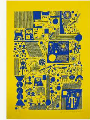
GEOMETRIC BANG * SENZA TITOLO

STAMPA RISOGRAPH A QUATTRO COLORI FEDRIGONI ARENA WHITE 140GR. 29,7 CM X 42 CM (A3). EDIZIONE LIMITATA DI 50 COPIE FIRMATE, NUMERATE E TIMBRATE A SECCO DALL'ARTISTA.