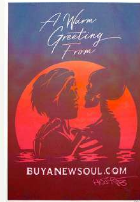
HOGRE "A WARM GREETING FROM BUYANEWSOUL.COM"

STAMPA SERIGRAFICA A DUE COLORI SU MOHAWK SUPERFINE SMOOTH 350GR. 29,7 CM X 42 CM (A3). EDIZIONE LIMITATA DI 50 COPIE FIRMATE E NUMERATE DALL'ARTISTA.